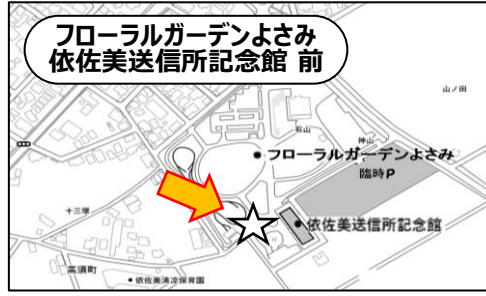
〒448-0812 刈谷市高須町石山2番地 1