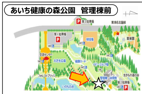
〒474-0038 愛知県大府市森岡町9丁目300番地