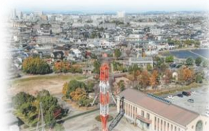
フローラルガーデン

集合場所：フローラルガーデンよさみ ・グローバルな地域をめぐり 自然を感じて散策しよう