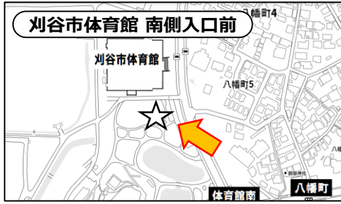
〒448-0838 刈谷市逢妻町4丁目32番地