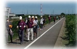
サイクリングロード

集合場所：ウイングアリーナ刈谷 西側入口前 ・川沿いの春見つけ旅 ~渡り鳥とすだれ梅~