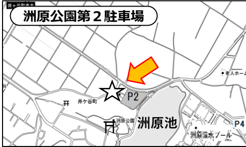
〒448-0001 刈谷市井ヶ谷町洲原4丁目1番地