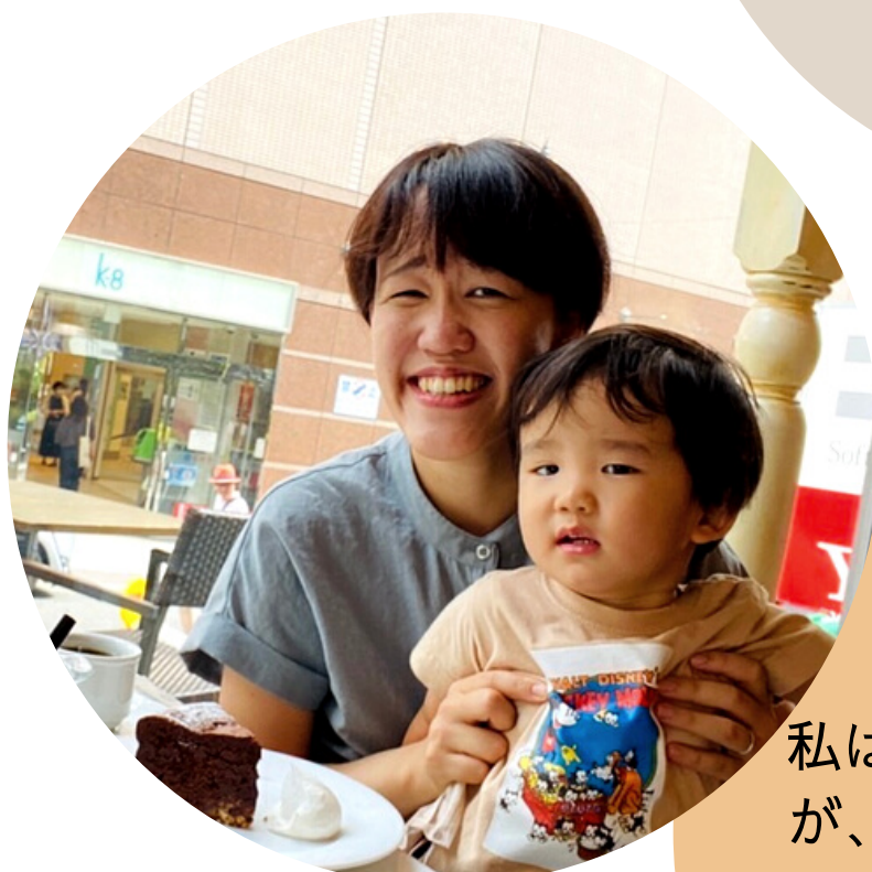
三宅さん 英語翻訳

WAFCAは外部との繋がりがあってこそこの団体。仲間を増やすためのPR活動、とてもやりがいを感じています。